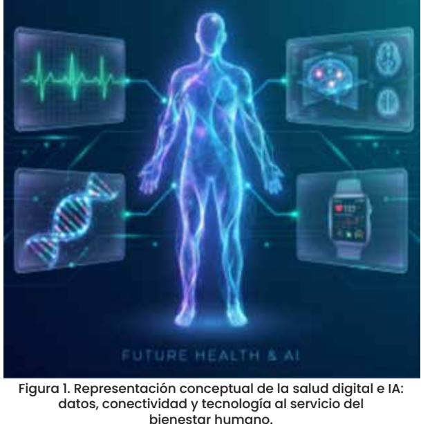
Figura 1. Representación conceptual de la salud digital e IA: datos, conectividad y tecnología al servicio del bienestar humano.