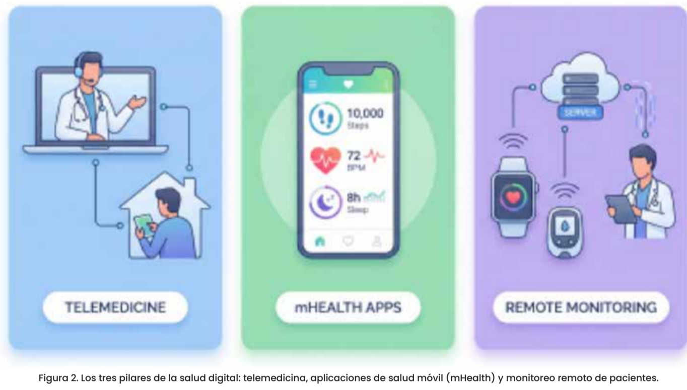
Figura 2. Los tres pilares de la salud digital: telemedicina, aplicaciones de salud móvil (mHealth) y monitoreo remoto de pacientes.