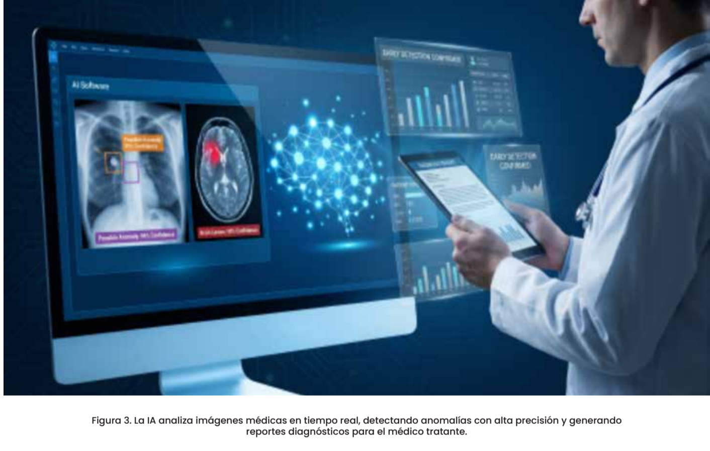
Figura 3. La IA analiza imágenes médicas en tiempo real, detectando anomalías con alta precisión y generando reportes diagnósticos para el médico tratante.

• Asistentes virtuales: Chatbots y asistentes de IA ayudan a gestionar síntomas, citas y medicación, apoyando la atención primaria.